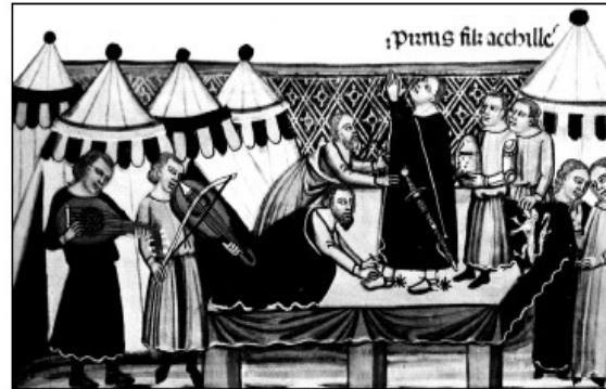
L'adoubement (miniature du XIV e siècle)

Les ..... pages ..... apprennent à monter à cheval et à manier l'épée dès .. 7 ... ans.